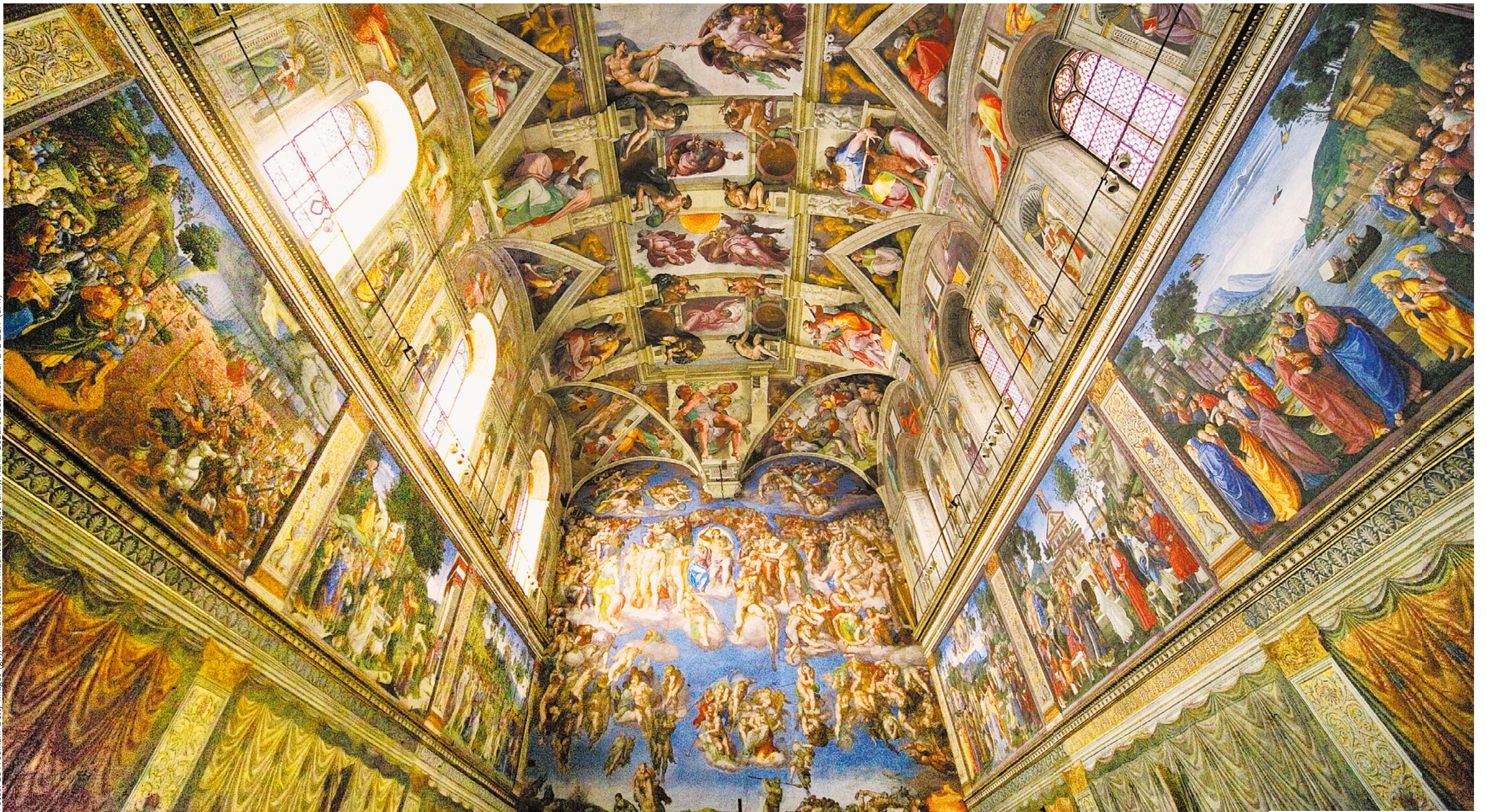
An der Decke Adam und sein Schöpfer (oben, Mitte) – die berühmtesten Zeigefinger der Welt