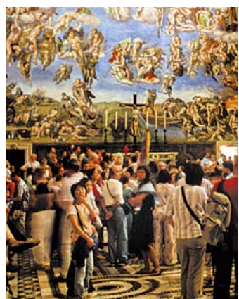
Blick auf das Jüngste Gericht: Im Rummel der Touristen – und in kleiner Gruppe